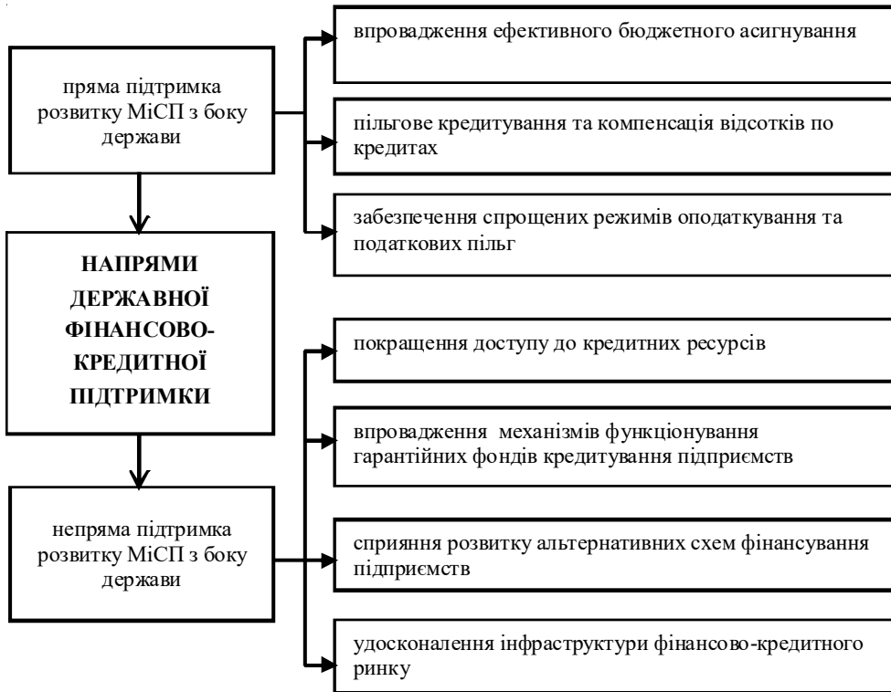
Рис. 2. Основні напрями державної фінансово-кредитної підтримки розвитку малих та середніх підприємств в Україні